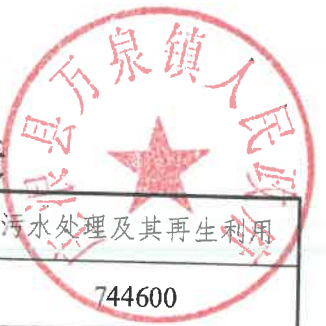
污染源自动监控设施安装登记表